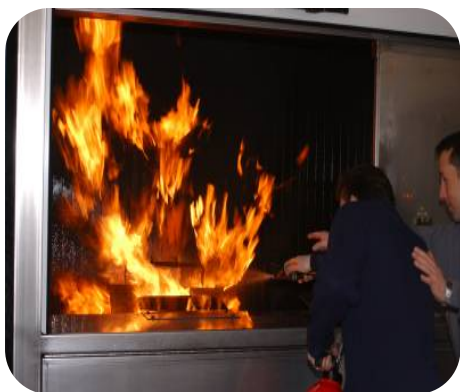
Exercices d'extinction sur feu réel de classe A et feu simulé de classe B

MOBIFEU 12, un véhicule de 17 mètres répartis sur deux zones distinctes et pouvant accueillir 12 stagiaires.