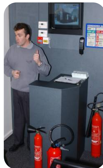
Supports audio visuels, matériels de démonstration