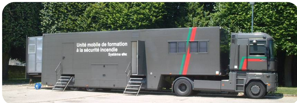
Véhicule climatisé, tout confort et respectant l'environnement

MOBIFEU 12, un véhicule de 17 mètres répartis sur deux zones distinctes et pouvant accueillir 12 stagiaires.