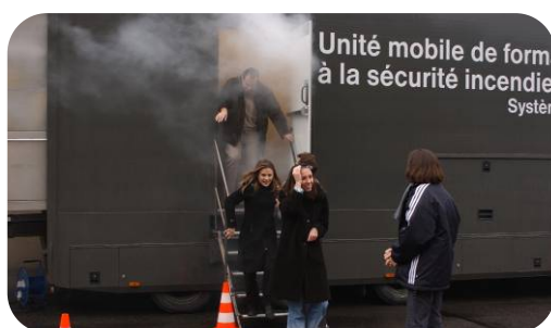
Évacuation en zone enfumée avec parcours modulable