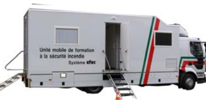
Spécifique locaux à sommeil ERP - types J.O.U.R mais aussi adaptable pour tout établissement